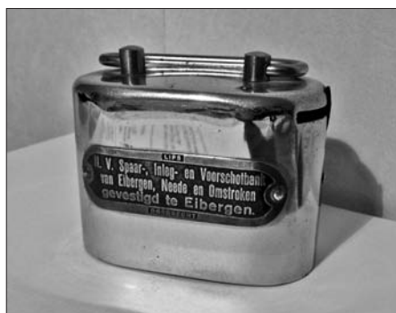
De bekende spaarbankbusjes van 50 jaar geleden. Aan de rechterkant een gleuf voor het muntgeld en links een klein rond gaatje voor het papiergeld, dat je wel eerst goed moest oprollen.