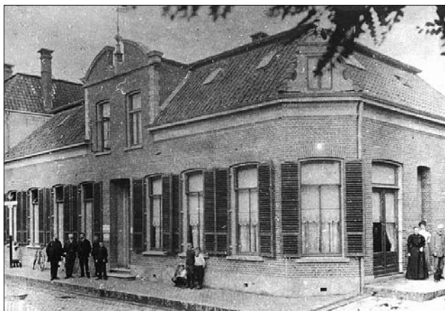
Het notariskantoor aan de Grotestraat 2 omstreeks 1900. (Sara Doetinchem, nr. 0856)

gaand aan de inschrijving in het kasboek, in een eigen zakboekje noteren. De spaarders moesten er maar van uitgaan dat de heren te goeder trouw waren en de tegoeden ook daadwerkelijk noteerden. Slotboom uit Olden Eibergen legde f15,- in en was daarmee een van de eerste klanten van de bank. Dertig cent was het kleinste bedrag en dat kwam van een van de dienstbodes van de familie Ter Braak.