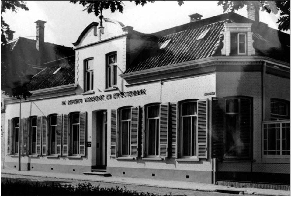
Foto van de Depositobank uit de jaren '60.