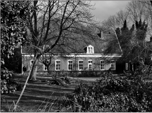
Boerderij De Könnink op 't Loo (foto: J. Baake).

cus H.W. Heuvel (1864-1926) vertelt dat er volgens overlevering op Griizen, nu Bisperink, een nieuwe boerderij zou worden bijgebouwd voor een van de zonen. Het lot zou uitmaken wie op de nieuwe plaats zou komen. Er werd 'könnink eschottene', wat met de kermis ook gebeurde. Wie de vogel trof, kwam op de nieuwe plaats, die zo de naam de Könnink kreeg. De boerderij ligt aan een lange oprijlaan met de indrukwekkende voorgevel naar de Berkel. Momenteel wordt die boerderij bewoond door mevrouw C. Strumphler-van de Loo.