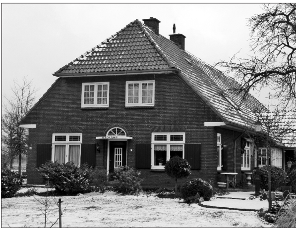
Boerderij Veldkamp.