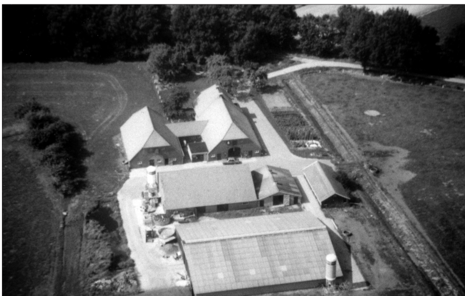
Luchtopname van boerderij Veldkamp.