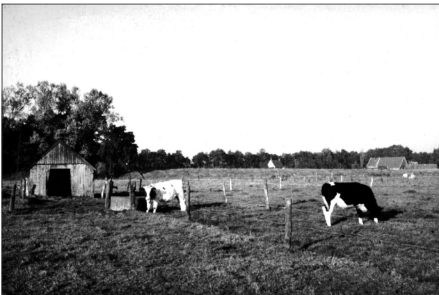
De Möllenmos met veeschuurtje. In de verte rechts boerderij Hofman aan de Rekkensebinnenweg.