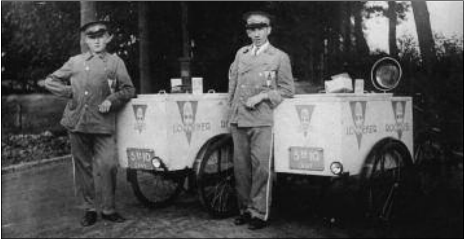
De Viersprong aan het eind van de Groenloschestraat was een geliefde plek voor ijscoverters. Zo stonden daar in de jaren '30 al de gebroeders Meuleman met hun Lonnekerroomijs.