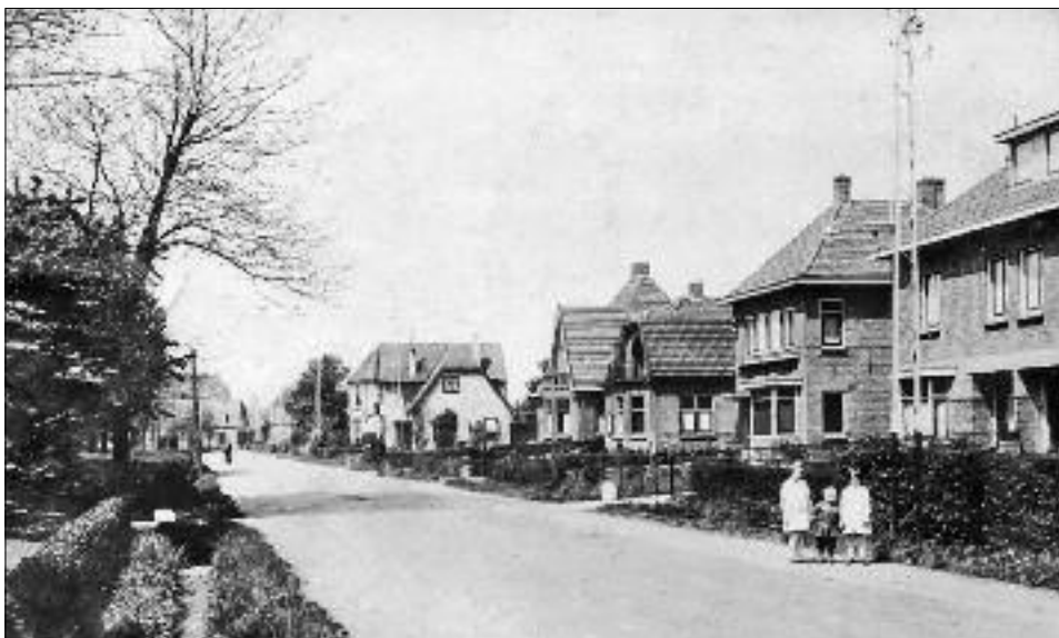
Van rechts naar links de voormalige woonhuizen van onder anderen -de voordeur is nog net te zien- op nr. 79 de familie Luimes, op nr. 77 de familie Mast, op nr. 75 de familie Schneider; op nr. 73 de familie Hartink en op nr. 71 de familie Sprick. Na dat laatste huis ligt de Blomsgaarden. Eertijds lag er aan de linkerkant van de Groenloschestraat nog een sloot.