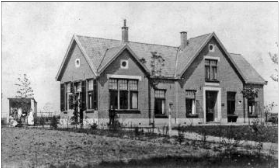
Het protestants-christelijk ziekenhuis in Eibergen in 1911. Links ervan staat een huisje voor tbc-patiënten dat met de zon kon worden meege draaid. In 1913 zou een kleine uitbreiding plaatsvinden waaronder de aanbouw van een serre aan de voorzijde.

In het pand na Overman op nr. 64 hebben in de loop der jaren verschillende families gewoond: Harmsen, deponhouder van Van Gend&Loos waar je pakjes kon afgeven, Ten Barge, timmerman en later taxi-ondernemer en autorijschoolhouder, Timmermans, oorlogsvrijwilliger in Indië en vertegenwoordiger in confectie en Ten Harkel, werkzaam bij de KTV. 4