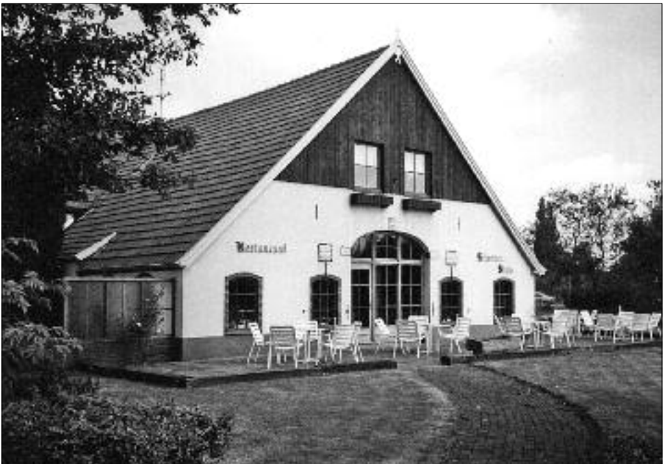
De tot Schweizer Stube verbouwde boerderij Koerhuis in de jaren '70.