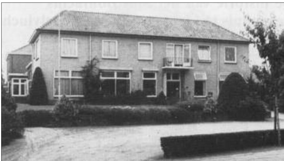
Het voormalige protestants-christelijk ziekenhuis na de verbouwing in 1950, toen in gebruik als verzorgingstehuis voor minder valide bejaarden. De foto is genomen enkele maanden na de sluiting in januari 1980.