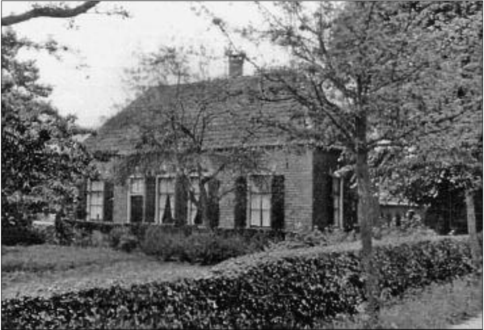
De oorspronkelijke boerderij Koerhuis in de jaren '30.