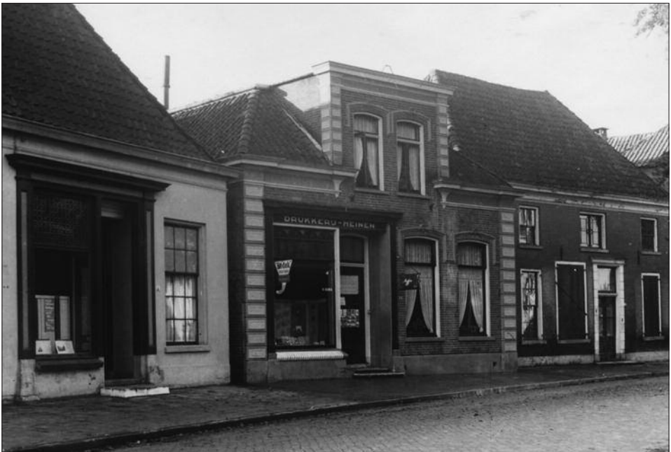
Drukkerij Heinen in de Grotestraat.

Opvallend is hoezeer alle partijen, Drukkerij Heinen, de Middenstandsverenigingen en de adverteerders in het laatste nummer moeite doen om de lezers een hart onder de riem te steken. Enkele voorbeelden: