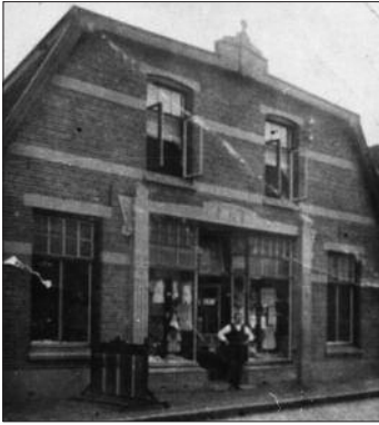
Kledingwinkel De Duif aan de Nieuwestraat.

‘De noodzakelijk geworden papierbeperking noopt ons thans de uitgifte van Onze Gids te staken. Maar wij zijn overtuigd dat bij terugkeer naar normaler tijden Onze Gids weer zal herrijzen’.