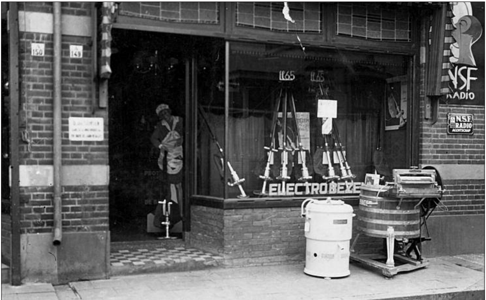
Electrowinkeltje van Somsen in de Groenloeschestraat thans J.W. Hagemanstraat.

..... 't Contact per 'Gids' is nu verbroken, Komt gij bij ons, wij houden moed. De handen in elkaar gestoken Dan wordt het zoo het wezen moet. De resultaten zult gij merken, Het adres voor U dat is zeer fijn: Voor Radio, Licht en Kracht(ige) werken Moet U nog steeds bij SOMSEN zijn.